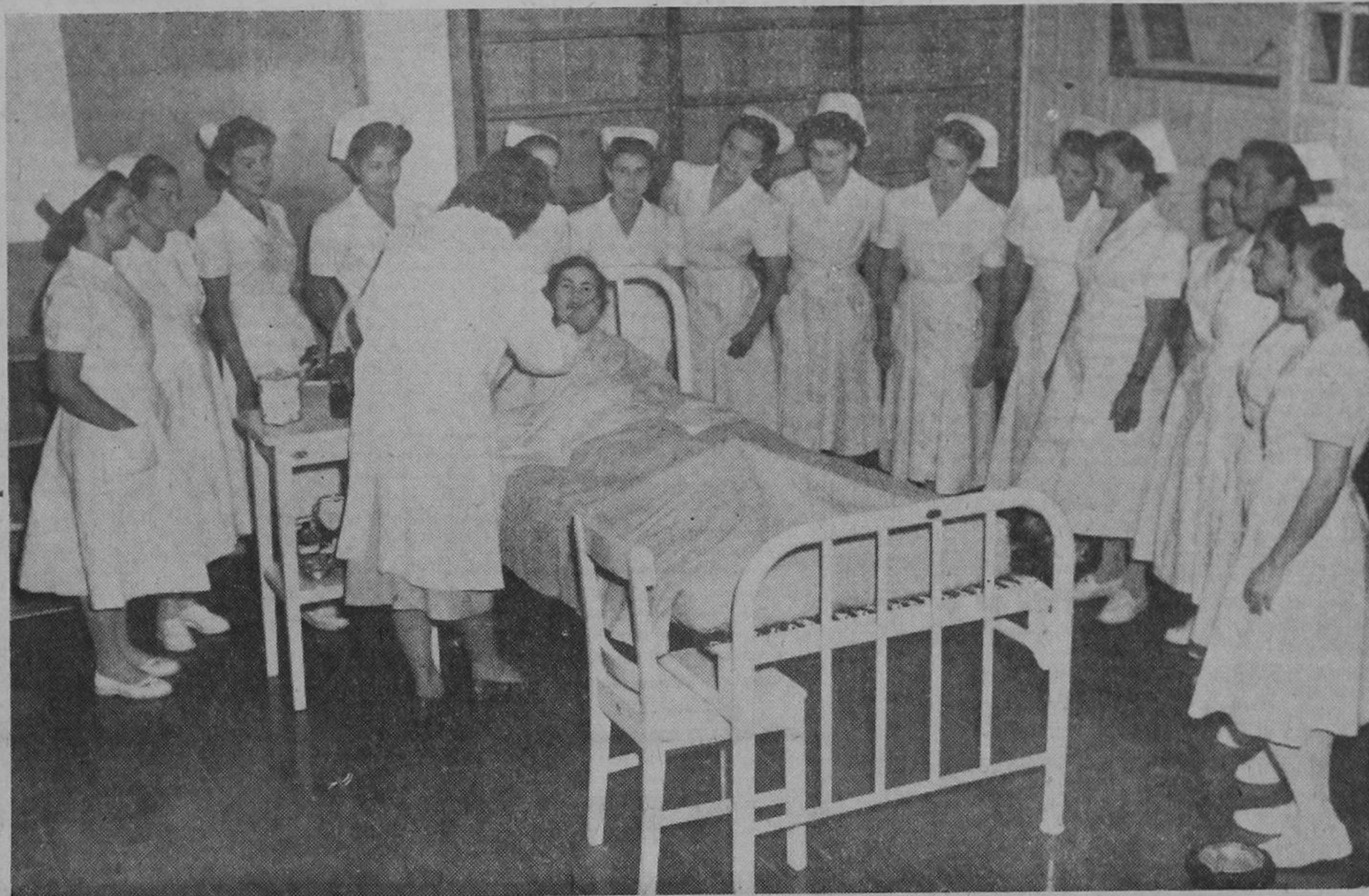
CURSOS PARA ENFERMERAS. — Curso de capacitación para auxiliares de enfermería, como parte de un plan para entrenar al personal del Seguro Social, y poder ofrecer un mejor servicio a enfermos y asegurados.